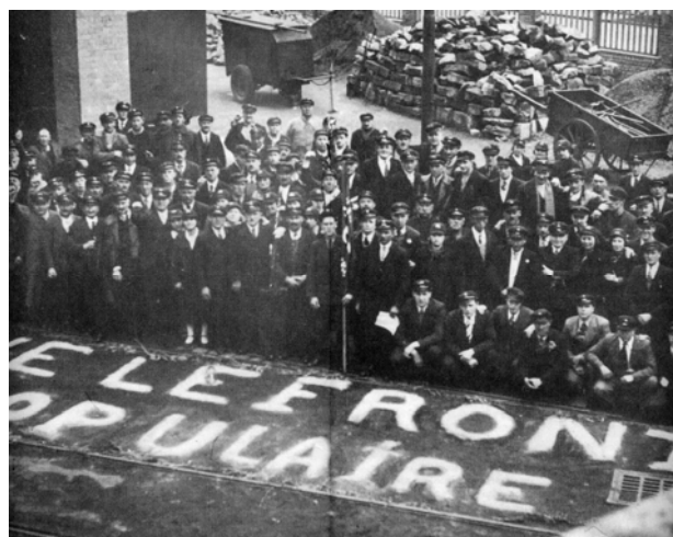
Les Traminois de Dunkerque en grève en 1936